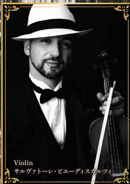
Violin サルヴァトーレ・ピエーディスカルツィ